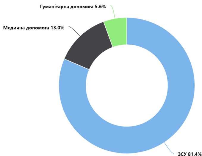
Загальні збори, United 24