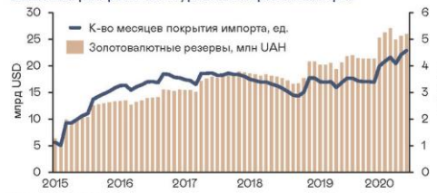
Валютные резервы НБУ и уровень покрытия импорта

Рост золотовалютных резервов Украины замедлился, впрочем из-за снижения объемов импорта покрытие на максимум за 9 лет