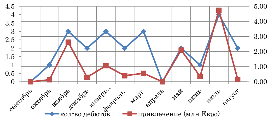
График дебютов NewConnect